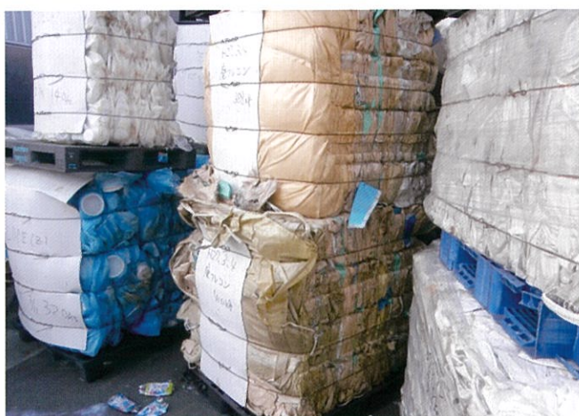
廃フレコンバッグ(約400kg)