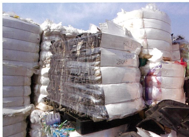
HDPEジャバラパイプ(約280kg)