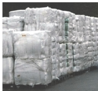
軟質プラスチック