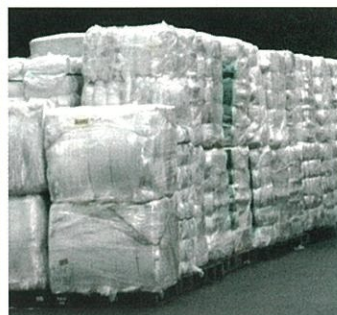
軟質プラスチック